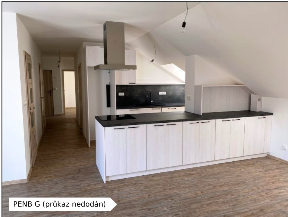
PENB G (průkaz nedodán)