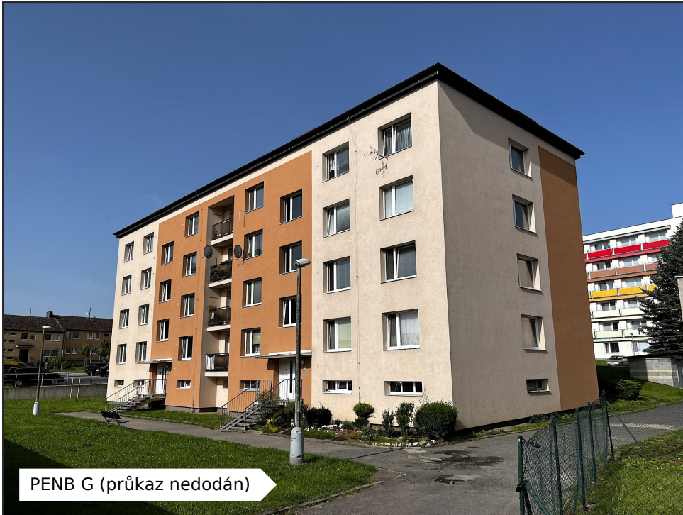
PENB G (průkaz nedodán)